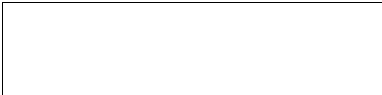
Схема монтажа ИБУ